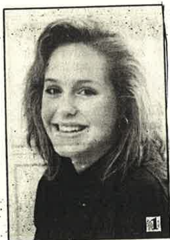
Bengtsfors Lucia 1989

Artiklar till årsskriften från släktmedlemmarna är det tunt med. Kom igen till nästa gång! - Var inte så blygsamma - .