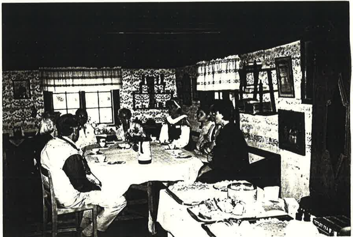
Från släktmötet. Kyrkkaffet avnjuts i kammaren, Gåserudsstugan