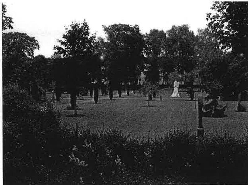
Landskrona gamla kyrkogård